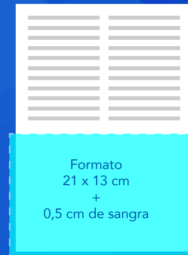
1/2 PÁGINA HORIZONTAL